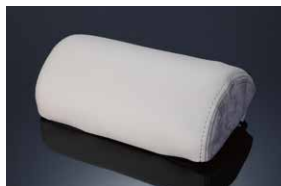
レザーネックパッド / アイボリー