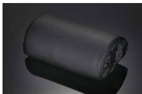
レザーネックパッド / ブラック