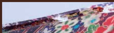
透き通る様なアクリルに素材を生かした美しい 品質を実現しました。