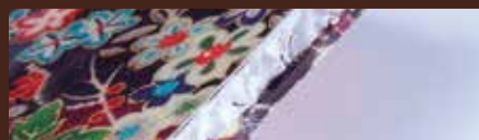
京・一越友禅の生地素材をアクリルと併せた舞香 こだわりの特殊製法です。

京都の誇る伝統の「一越友禅」にアクリルを流し込み、 ちりめん生地をサンドした特殊製法でお届けします。