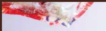
アクリルの破片から生地がはっきりと確認いた だけます。